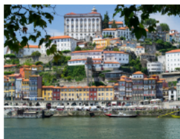
Porto - Ribeira

Tag 8: Transfer zum Flughafen Lissabon und Rückflug via Zürich nach Berlin.