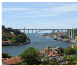
Lissabon - Tejobrücke

Mittwoch, 09. und 30. September um 17 Uhr im Knaaksaal in der Georgenkirchstraße 70, Berlin.