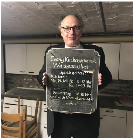
Fundstück aus dem Pfarrhauskeller